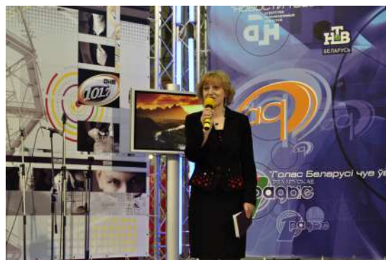
На международной специализированной выставке "СМИ в Беларуси"

СМИ "Изменим мир к лучшему". Кроме того, совсем недавно прошел 25-летний юбилей моей родной газеты "Переходный возраст", который мы отмечали на международной специализированной выставке "СМИ в Беларуси - 2019". Это торжественное мероприятие совместно со своей ученицей я вела в образе мамы.