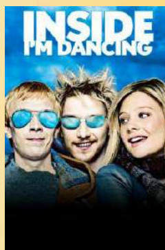
Постер фильма "А в душе я танцую"

Дождливая погода за окном мысленно переносит меня в Туманный Альбион. И есть чудесный английский фильм "А в душе я танцую", который рассказывает нам историю парня Майкла, больного церебральным параличом, и его друга Рори, благодаря которому жизнь Майкла заиграла новыми красками.