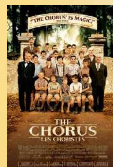
Постер фильма "Хористы"

Французская картина о человеческой доброте и упорстве, ставшая мировым шедевром кинематографа, создана в 2004 году. В ней рассказывается история про детей и взрослых, педагога и его учениках. Так, скромный учитель музыки попадает в интернат для трудных подростков. Там он сталкивается с жестоким обращением ректора заведения с учащимися. "Изысканные" воспитательные меры вызывают у тех только агрессию. Не в силах открыто выступить против подобных методов, молодой педагог решает организовать школьный хор. К чему привело появление музыки в жизни юных сорванцов вместе с человеческим добродушием и состраданием, вы узнаете, посмотрев фильм.