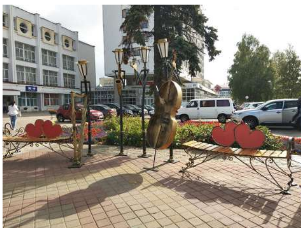
Фонари на музыкальных инструментах