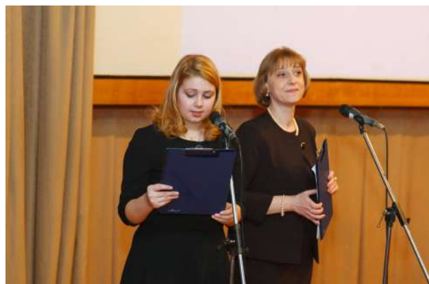
На городском конкурсе детско-юношеских СМИ "Изменим мир к лучшему"