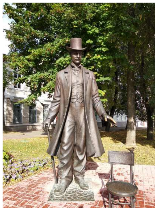
Памятник Федору Махнову

Приезжайте в Витебск, и вы все увидите своими глазами!