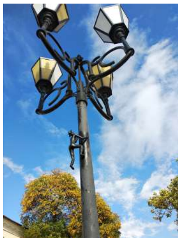
Дядя Витя, ползущий на фонарь

Продолжить знакомство с современным искусством вы сможете вечером на пешеходных улицах Суворова и Толстого, посидев на скамеечке с дядей Витей, весьма образной скульптурной композицией, живущей в фонарях. Он сидит или стоит, или как-то развлекается: снимает шляпу, играет на гитаре, ползет по фонарю.