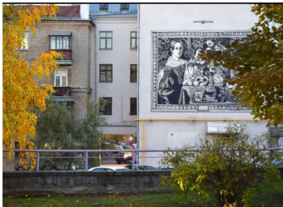
г. Минск, ул. К.Маркса, д. 25