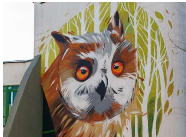
г. Минск, ул. Плеханова, д. 18а

Сегодня в Минске уже несколько десятков масштабных (высотой в несколько этажей) и не очень (на трансформаторных подстанциях и заборах) стрит-арт работ по различной тематике. Они созданы во время проведения фестивалей и проектов, и вне их. Граффити, как творчество уличных живописцев, уже переросло в белорусский стрит-арт и имеет мало общего с простыми рисунками на заборе или странными художествами на стенах и фасадах зданий.