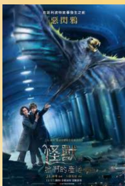
Постер фильма "Фантастические твари и где они обитают"